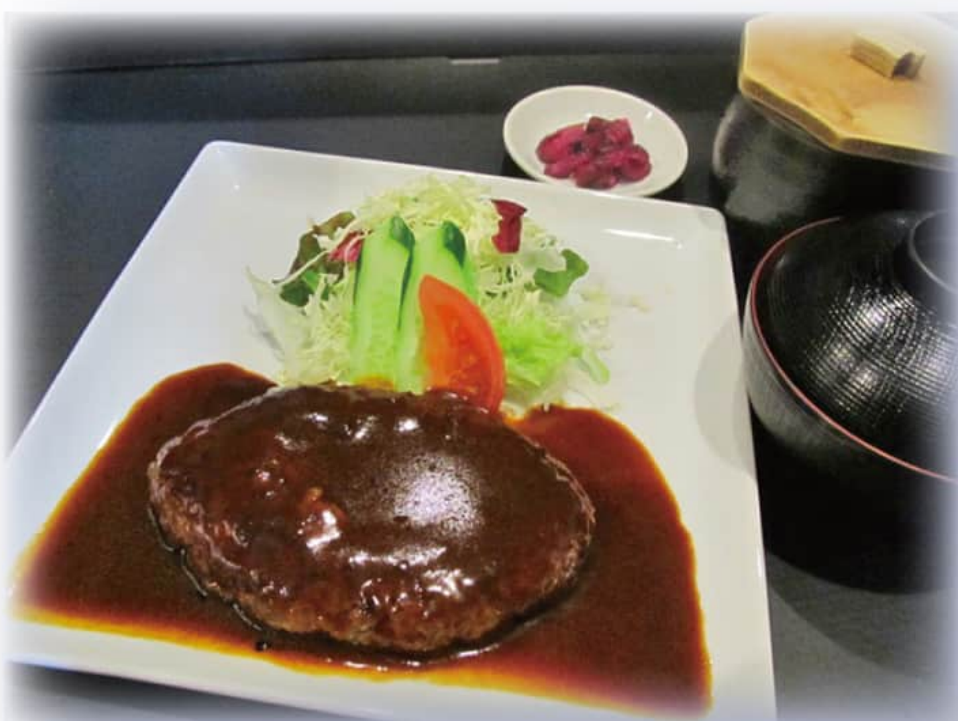
ハンバーグステーキ定食 ¥1,300