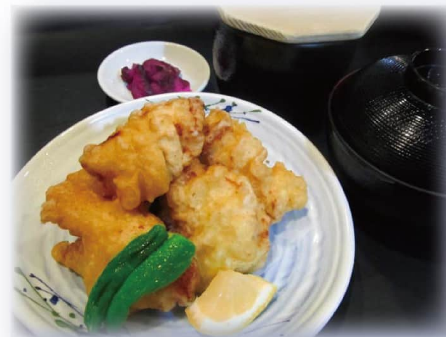
鶏むね肉の柚子胡椒揚げ定食 ¥850