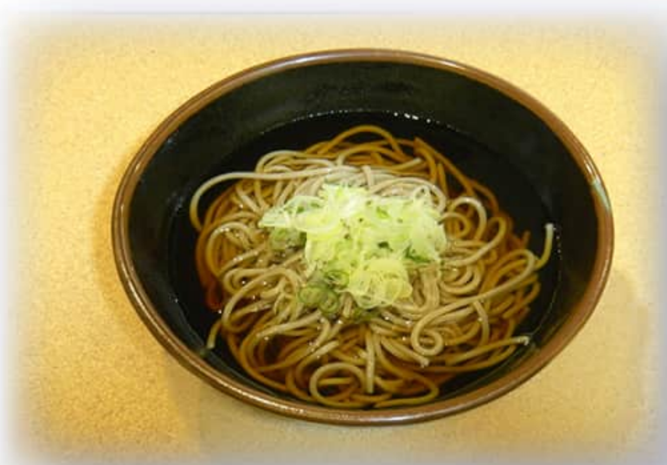
かけそば ¥ 700