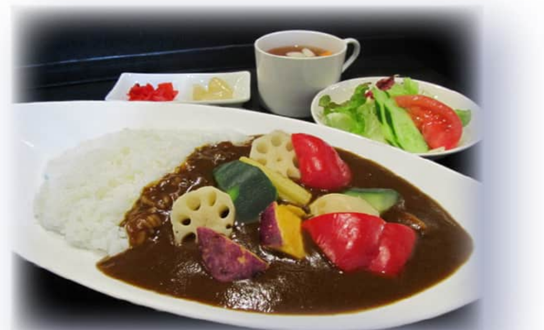
野菜と豚肉の ごろっとカレー