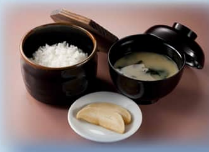
ご飯セット - ご飯・味噌汁・漬物 -