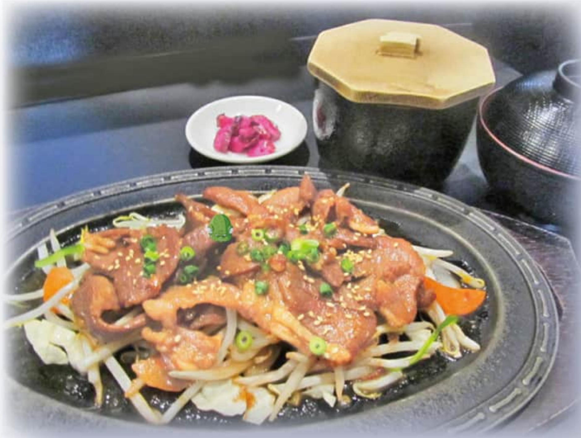
ジンギスカン定食 ¥1,400