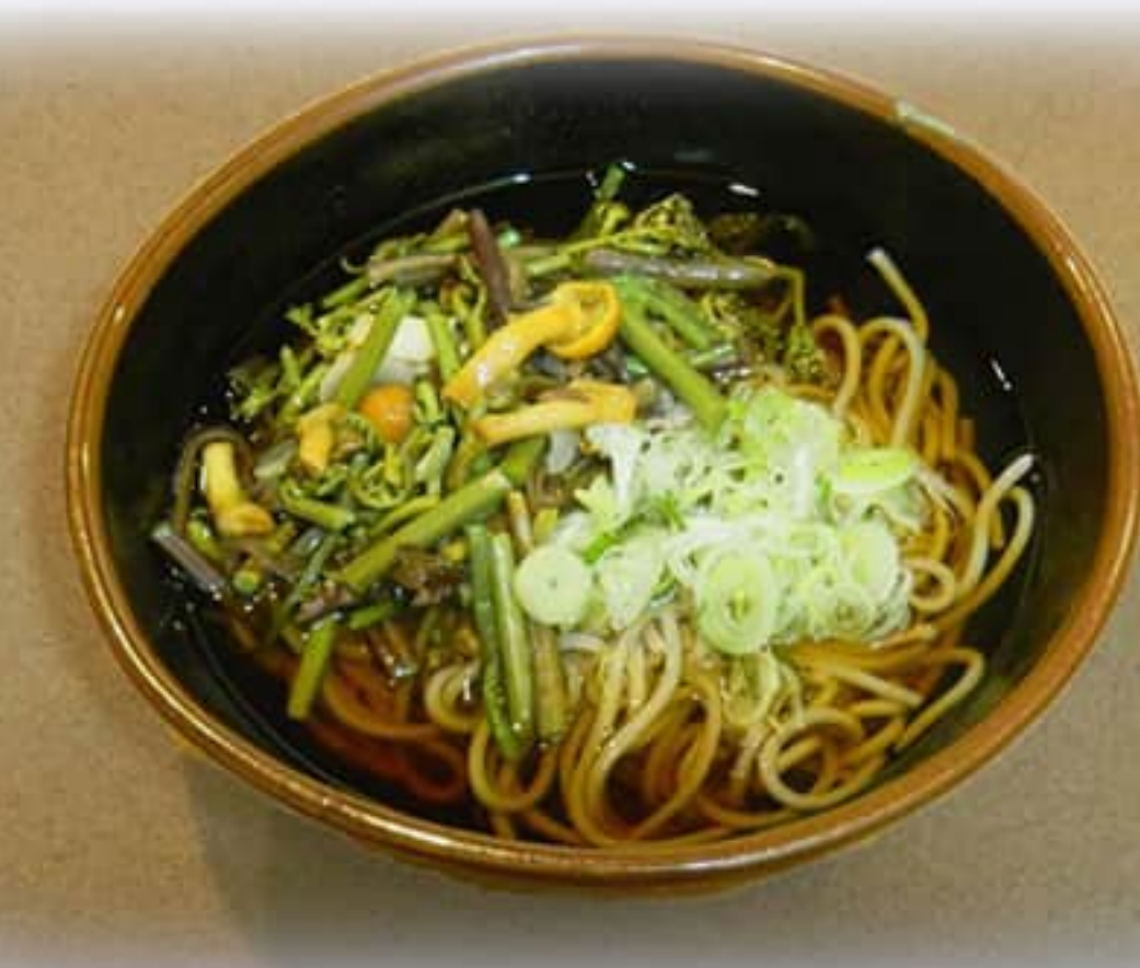
山菜そば ¥ 850