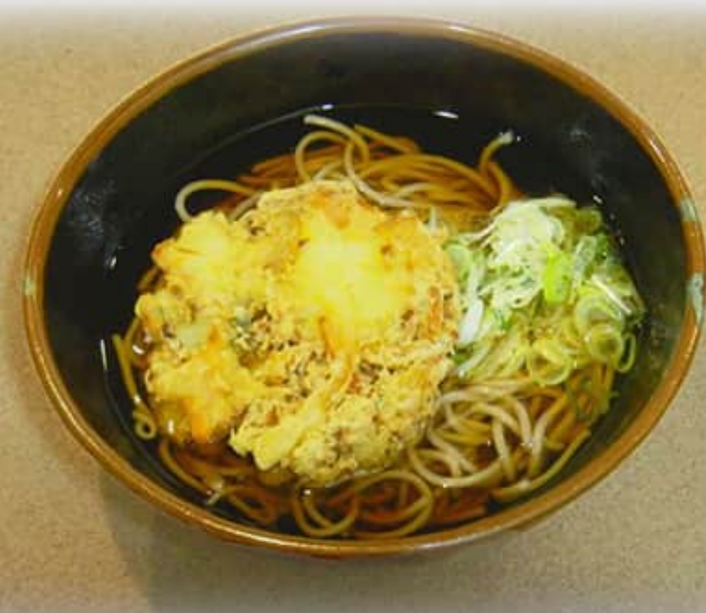
かき揚げそば ¥ 850