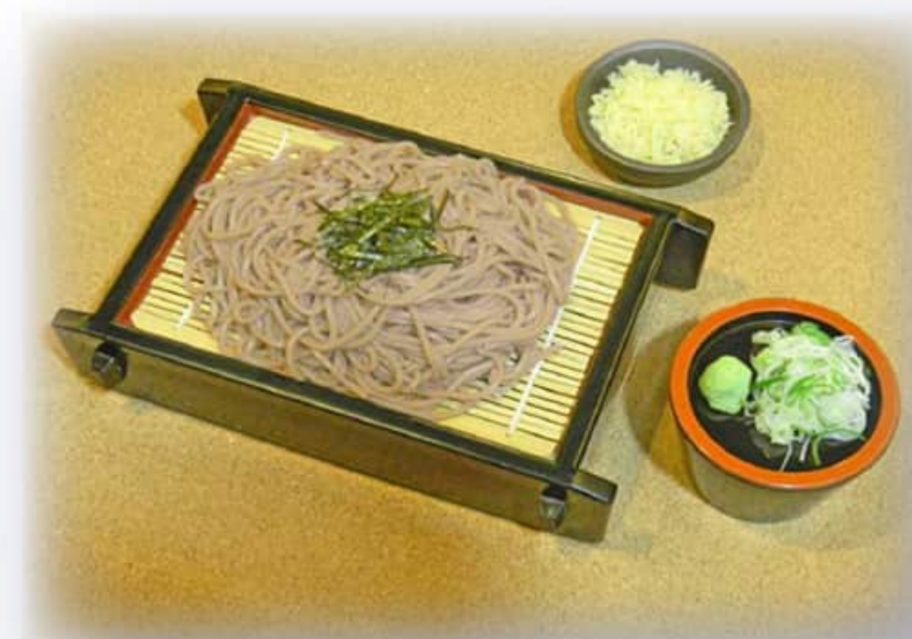
ざるそば ¥ 700