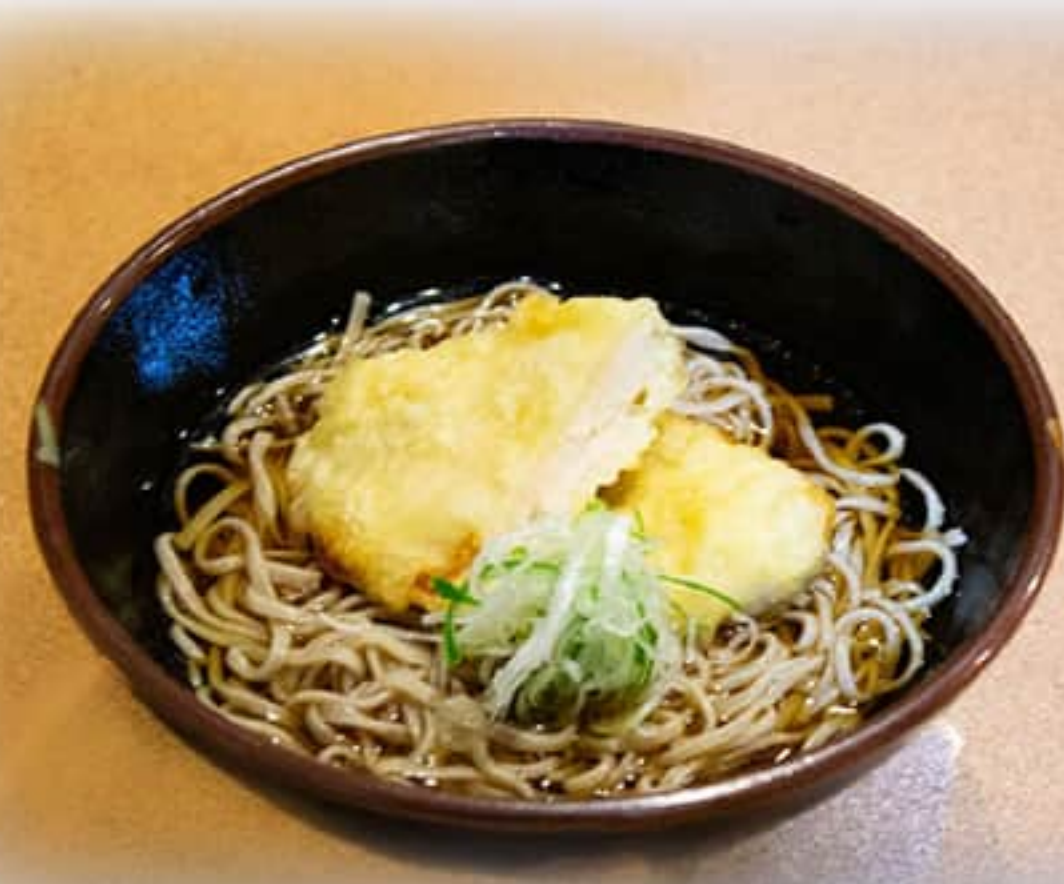
鶏天そば ¥ 850