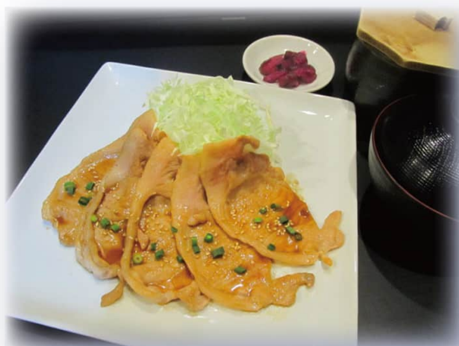
豚の生姜焼き定食 ¥1,150