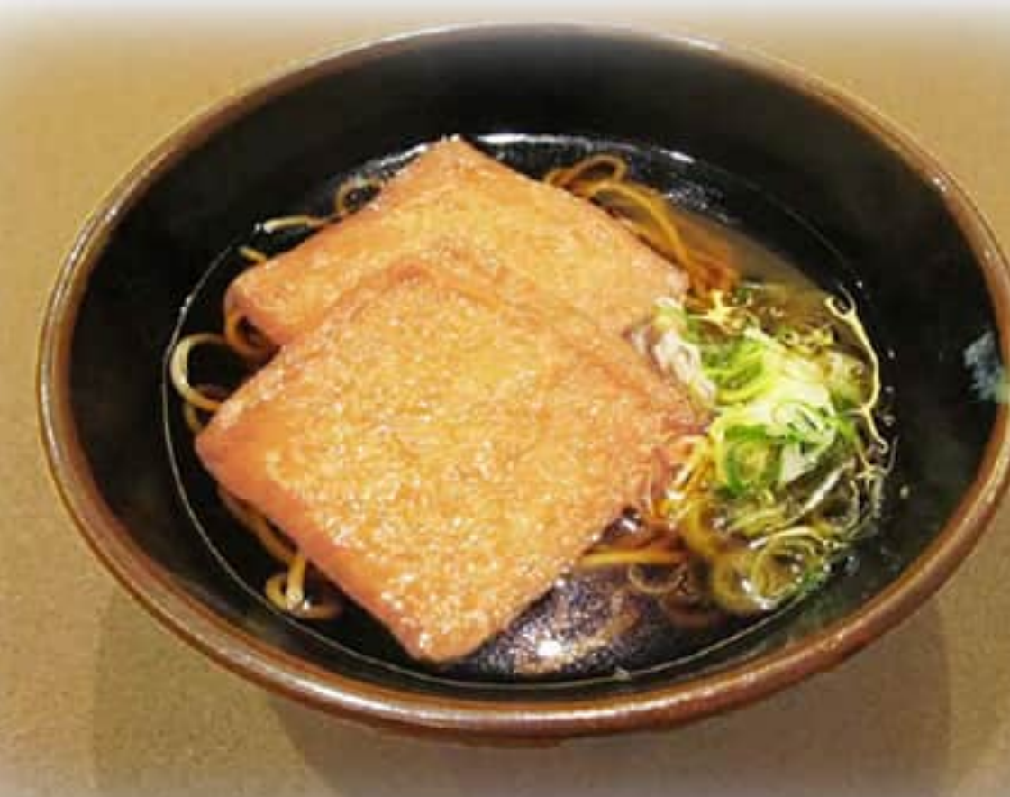
きつねそば ¥ 850