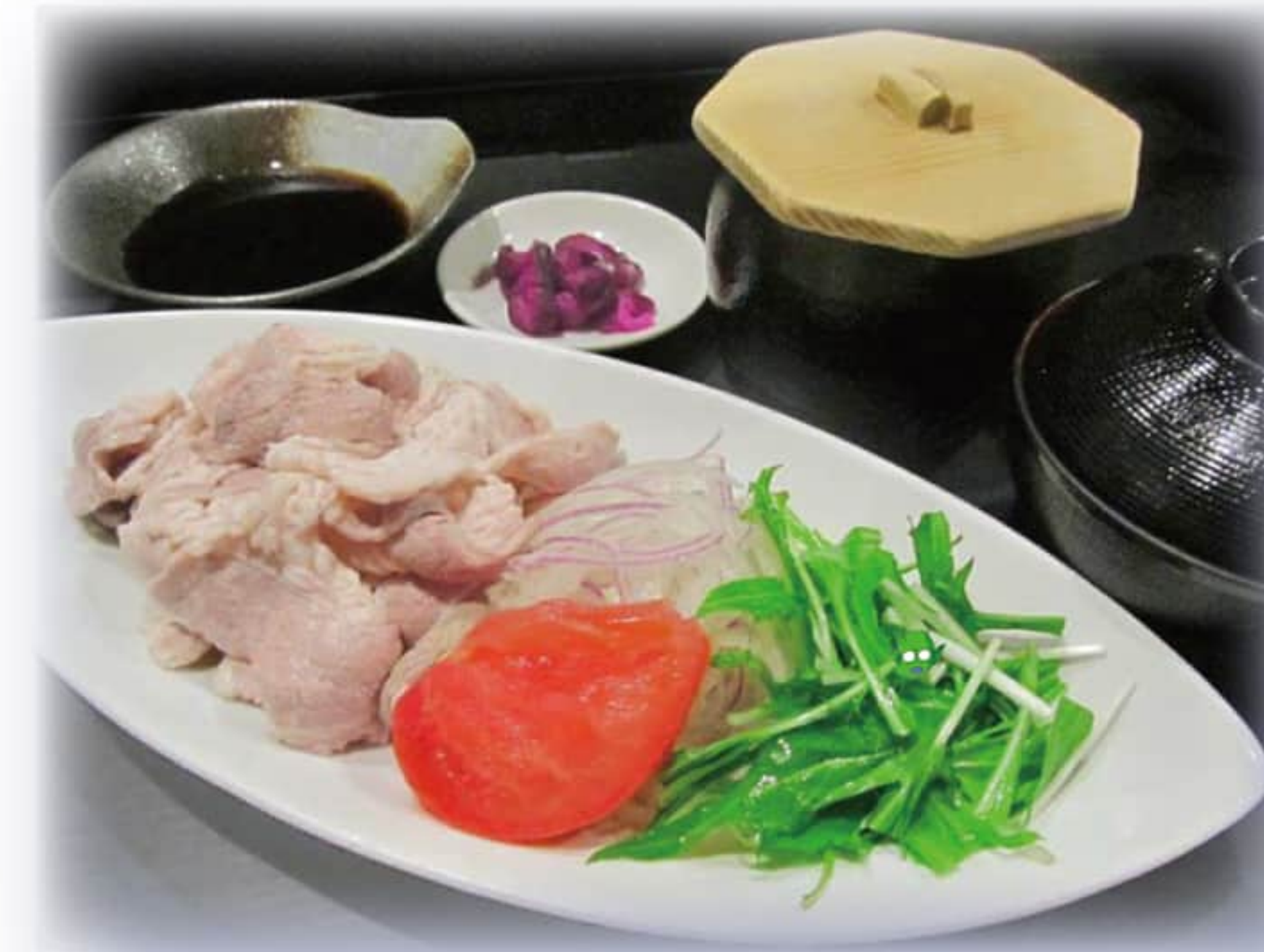
豚の冷しゃぶ定食 ¥1,150