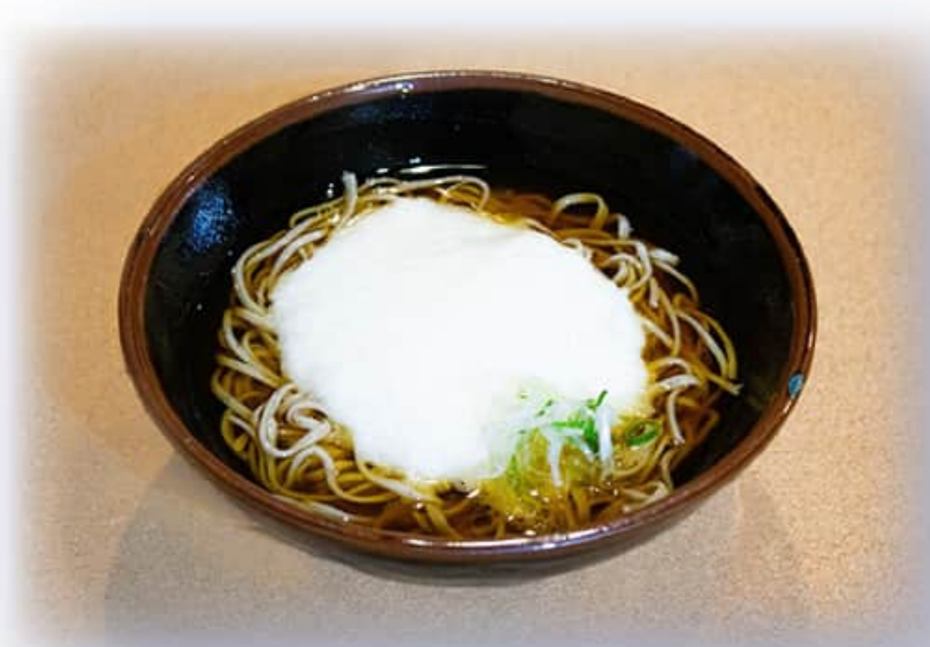
とろろそば ¥ 850